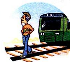
Слушать плеер и говорить по телефону вблизи железной дороги.