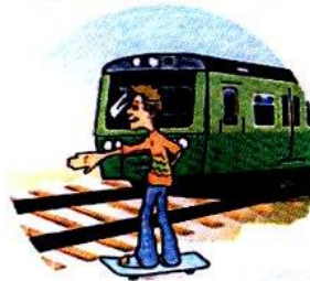
Кататься вблизи железной дороги.