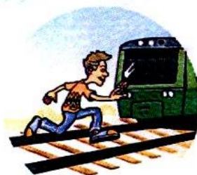
Перебегать пути перед поездом.

Слушать плеер и говорить по телефону, т. к. можно не услышать сигналы приближающегося поезда и объявления диктора.